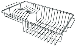
不锈钢背板 8100 201