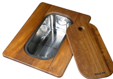
带不锈钢沥水篮的伊罗科木砧板 8644 044